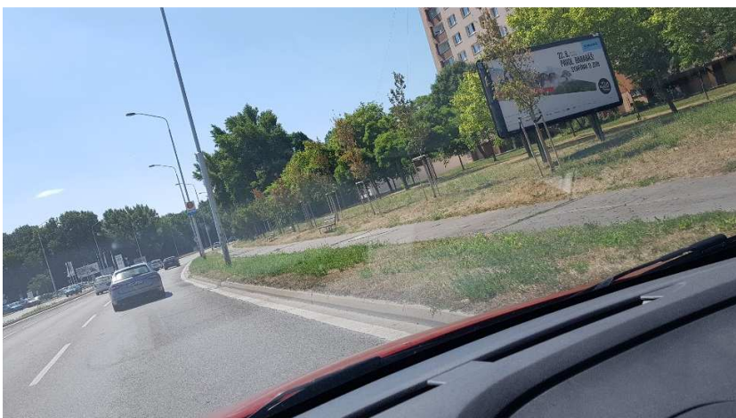
Starohájska ulica, BA-Petržálka