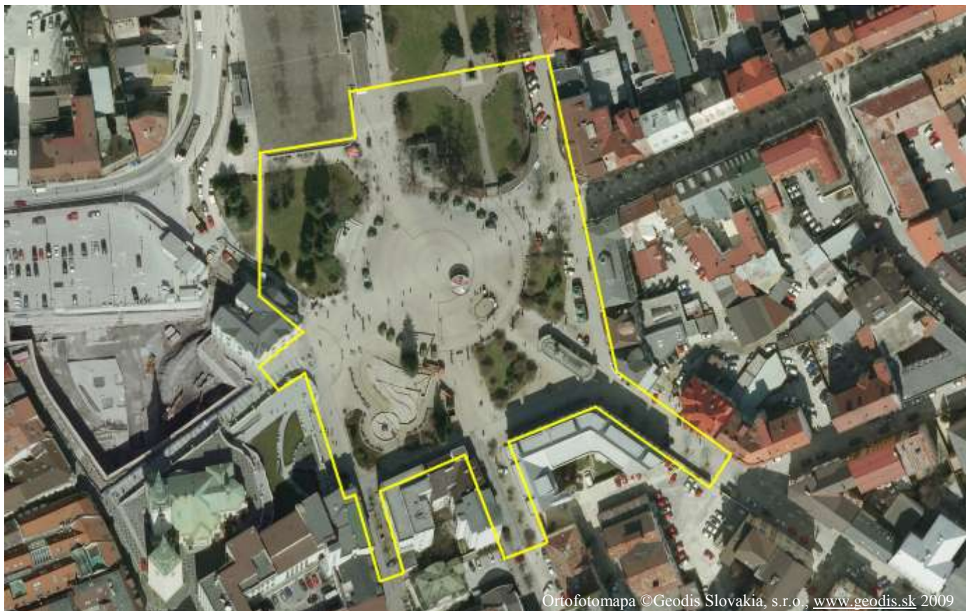
Vymedzenie riešeného územia