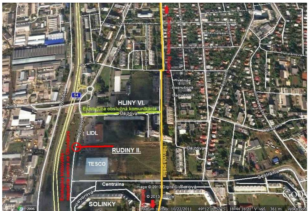
Uličný systém a vzťahy centra Rudiny II. k ostatným zónam

Centrum Rudiny II. je riešené v ÚPN-M Žilina v platnom znení. V predchádzajúcom období bolo riešených niekoľko urbanistických štúdií a tiež Územný plán zóny centra Rudiny II. Navrhnuté komplexné riešenie nebolo zrealizované, ale naopak na plochu plánovaného centra boli v nedávnej minulosti bez urbanistického overenia situované supermarkety LIDL a TESCO, čo vnieslo do územia mnohé dopravno-obslužné a hmotovo-priestorové komplikácie. Vytvorili sa tým aj nové a značné problémy, predovšetkým v dopravnej obsluhu zóny, ktoré je nutné vyriešiť v návrhoch II. centra mestského obvodu Rudiny.