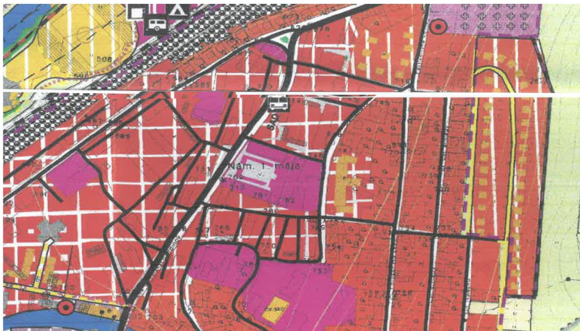
Výrez z Územného plánu sídelného útvaru Valaská – Komplexný urbanistický návrh