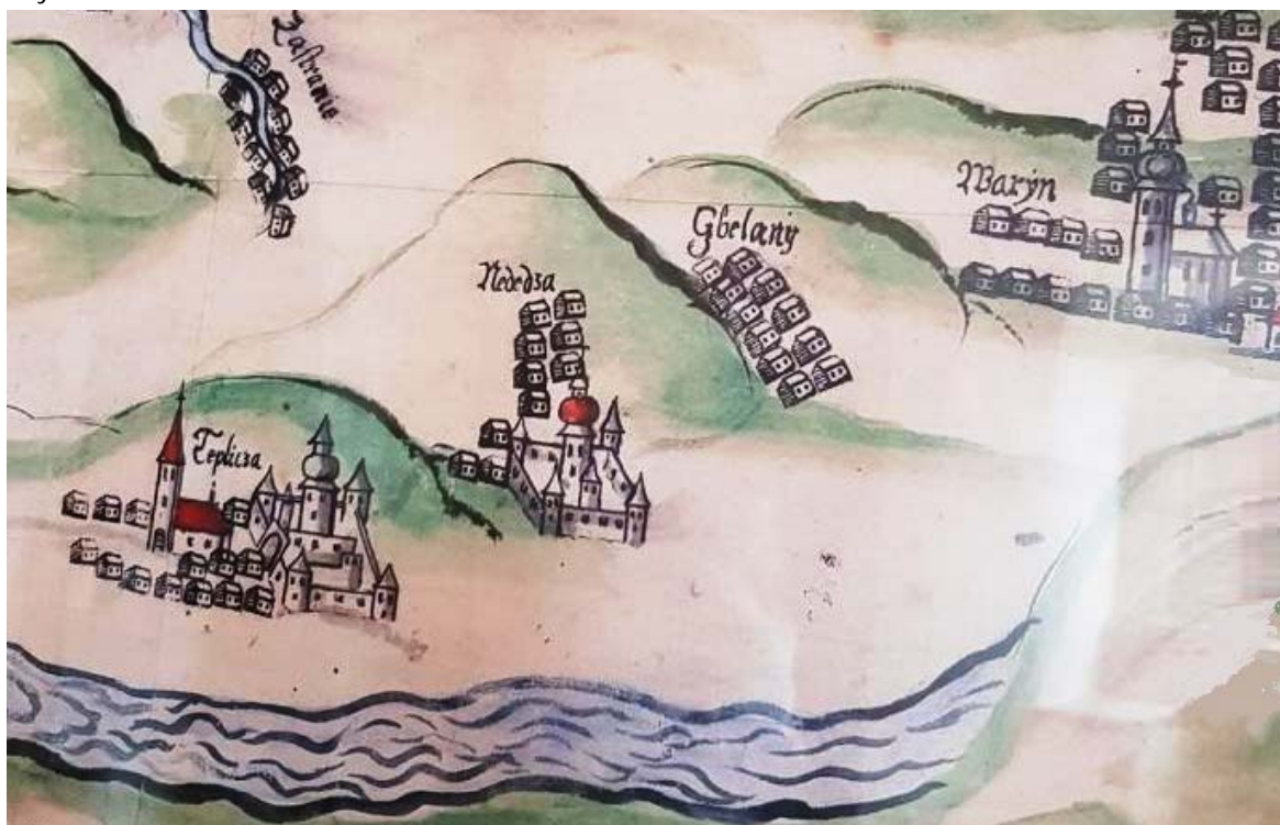
Dobový obraz historického osídlenia na pravej strane Váhu

8.1 Riešené územie centra je zároveň historickým centrom Nededze, čo dokumentuje o.i. dobová kresba osídlenia na pravom brehu Váhu. Centrum obce požaduje vyhlasovateľ riešiť ako pešiu zónu, ktorá je v dobrej pešej dostupnosti pre návštevníkov a obyvateľov. Túto je potrebné navrhnuť tak, aby bola dobre napojená pre peších a dopravnú obsluhu s minimalizovaním existujúcich a vytváraním nových kolíznych bodov a úsekov. Odporúča sa riešiť cyklistické napojenie centra obce na cyklotrasu zo Žiliny.