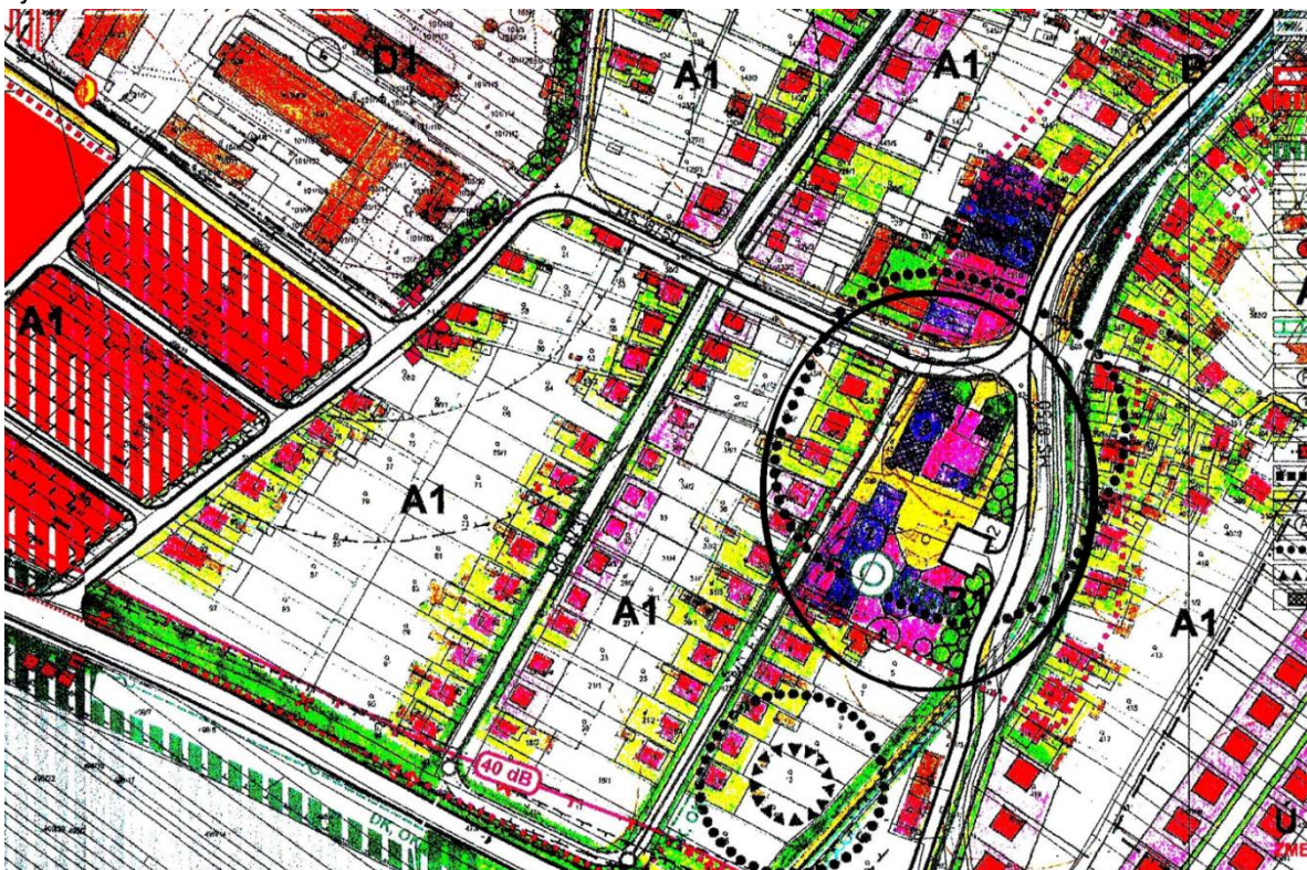
Výrez z ÚPN-O Nededza

Zámerom obce Nededza je v centre obce na Hlavnej ulici pred Obecným úradom a bývalým renesančným kaštieľom (vyčiarknutý zo zoznamu NKP SR) vybudovať námestie – centrálny verejný priestor. V Územnom pláne obce je priestor centra riešený intenzívnym využitím určeného územia v súlade s funkčným využitím. V ÚPN-O sa neplánuje asanácia žiadnych stavieb v riešenom území, ale oproti návrhu ÚPN-O je súčasný stav podstatne zmenený. Pôvodne chránené pamiatkové objekty sú z časti asanované a prestavané a preto ochranné pásmo kultúrnych pamiatok stráca opodstatnenie. Toto ochranné pásmo má sčasti opodstatnenie len z pohľadu zachovania zvyškov pôvodného kaštieľa zakomponovaných do kultúrno spoločenského objektu (v prestavbe) s kapacitou 40 návštevníkov denne a nového rímskokatolíckeho kostola. Problematické je trasovanie komunikácie – ulice Za kaštieľom a jej vyústenie do križovatky s ulicou Na Skotni, ktorá sa v oblúku križovatky priamo dotýka objektu kostola.