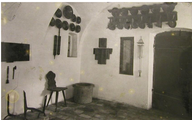
Vyobrazenie väzenskej kuchyne z prvej expozície z roku 1942.