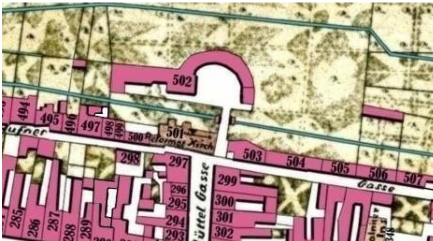
Miklušova väznica na Ottovom pláne z roku 1841 pod číslom 297.