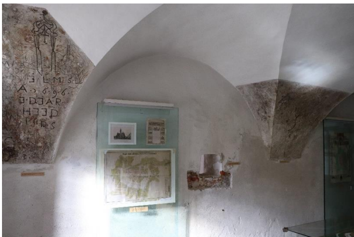
Východná spoločná mužská cela na prvom nadzemnom podlaží. Súčasný stav.