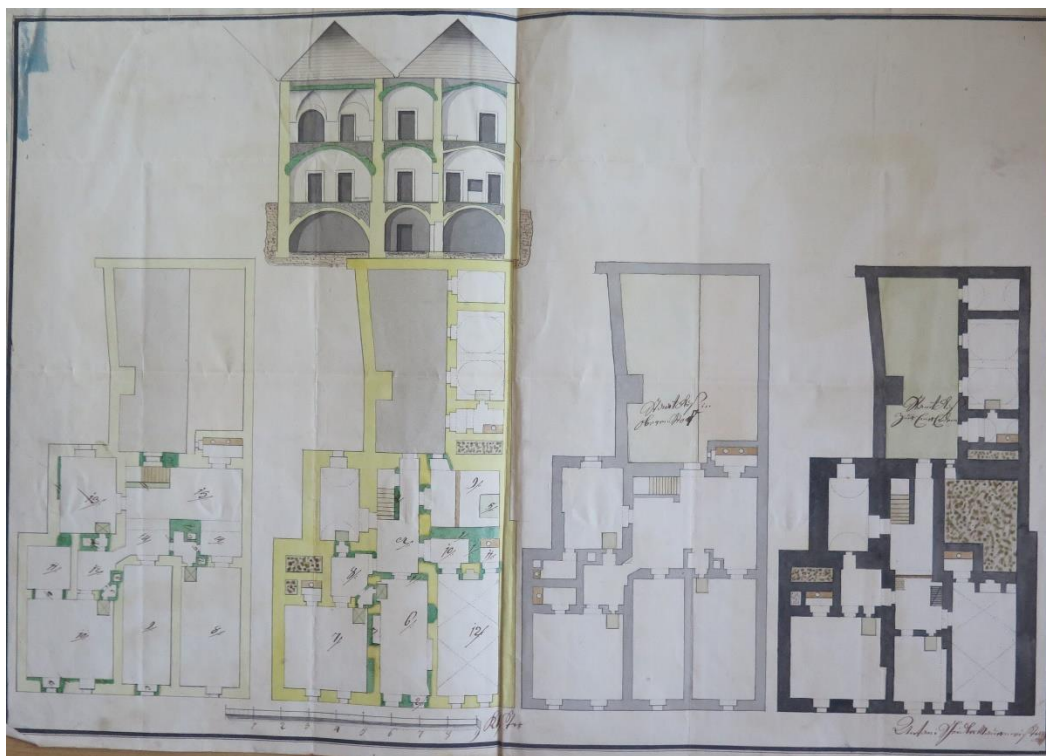
Plán mestskej väznice súvisiaci s jej prestavbou z roku 1788.