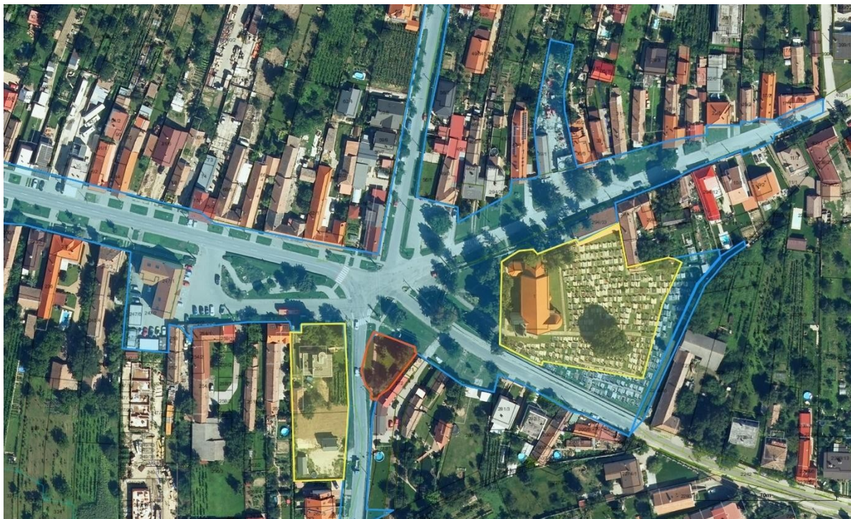
Obr. č.5 – majetko-právne vzťahy

Väčšina riešeného územia je vo vlastníctve obce. Cintorín s kostolom je vo vlastníctve Rímskokatolíckej cirkvi a parcela č E-KN 269 je v súkromnom vlastníctve, ale v súčasnosti je súčasťou verejného priestranstva obce.