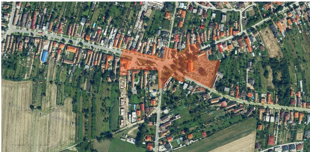
Obr. č.1 - vymedzenie riešeného územia

Celková plocha riešeného územia je približne 19 280 m 2 .