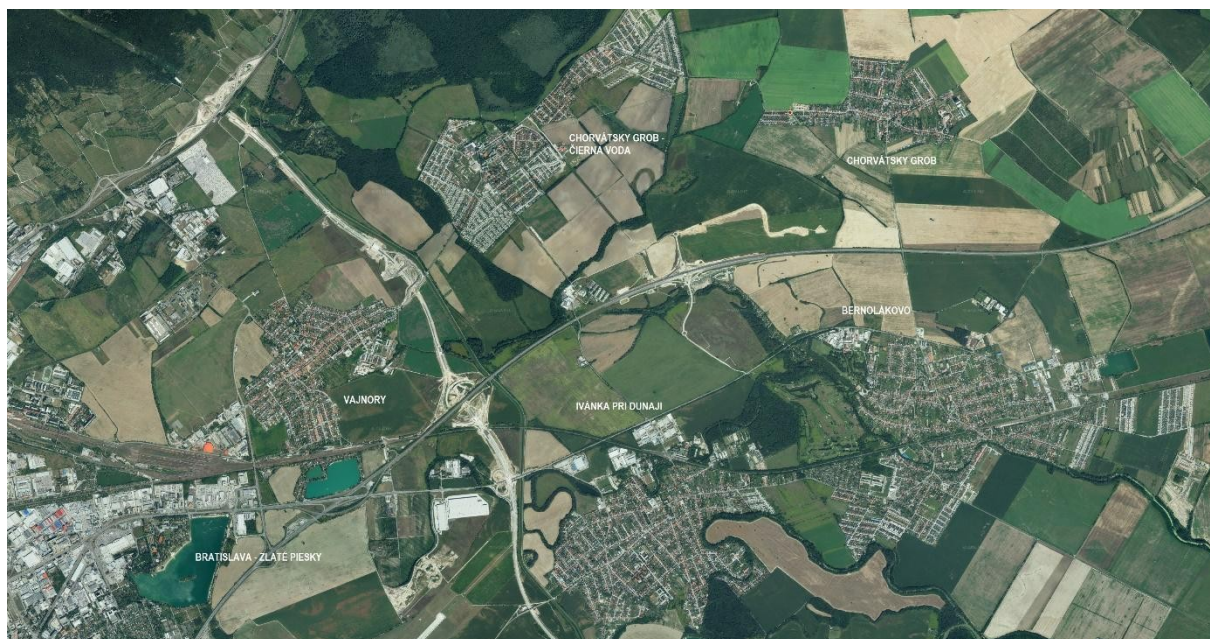
Obr. č. 2 – lokalizácia obce v rámci Bratislava – okolie

Riešené územie je vymedzené aj v súťažných pomôckach – mapových podkladoch dodaných vo formáte DWG.